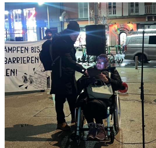
Aglaia mit Assistenz auf der Demo

Ich wohne in meiner barrierefreien Wohnung mit persönlicher Assistenz.